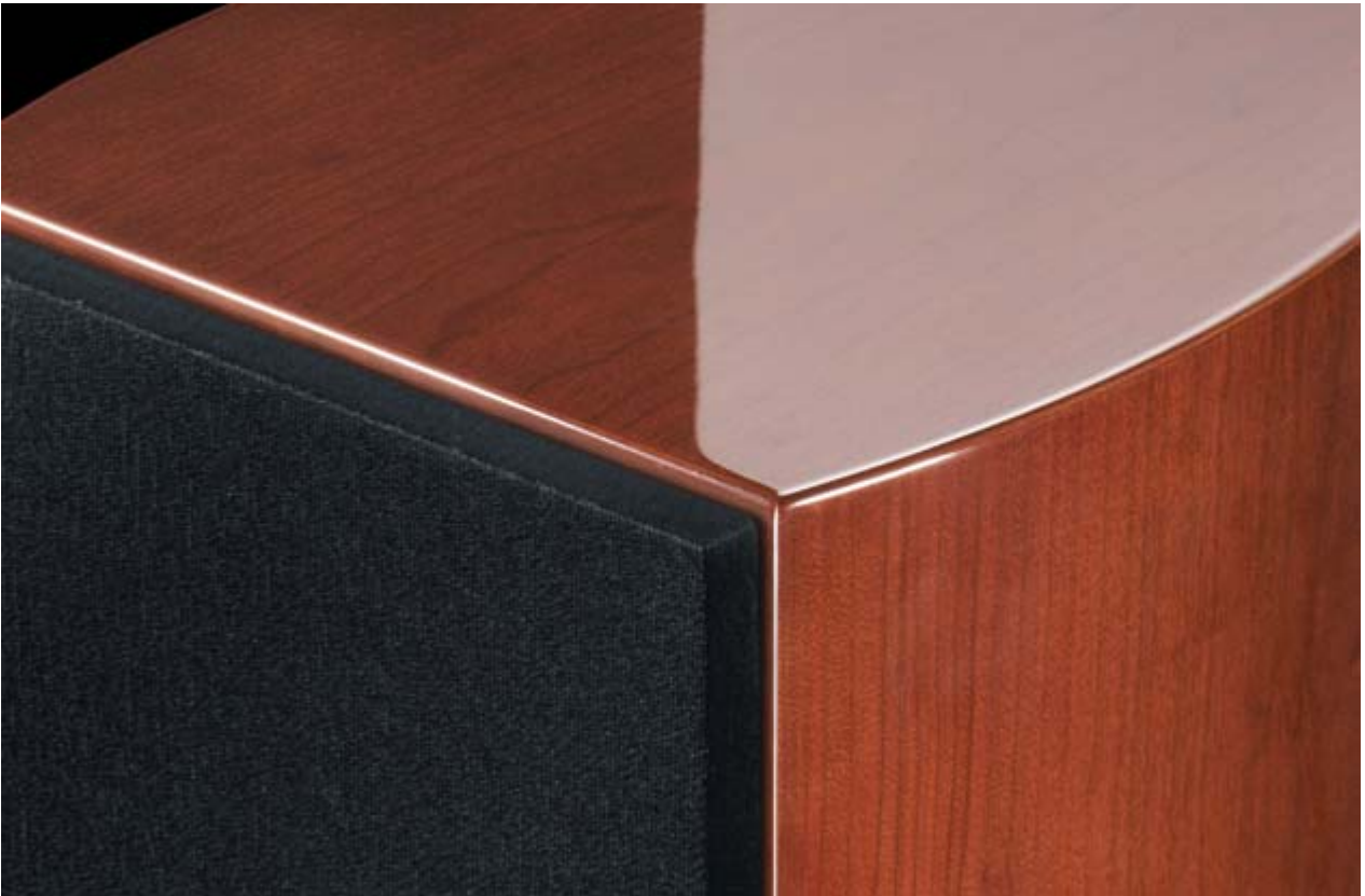
Kirsche Furnier „ high gloss “